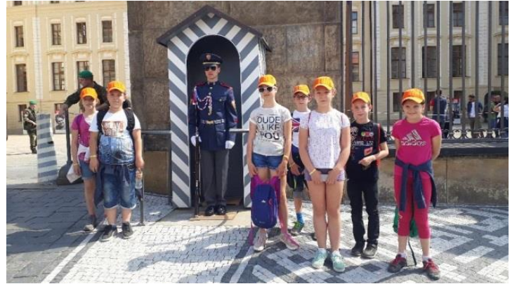
Výlet Praha 5. třída