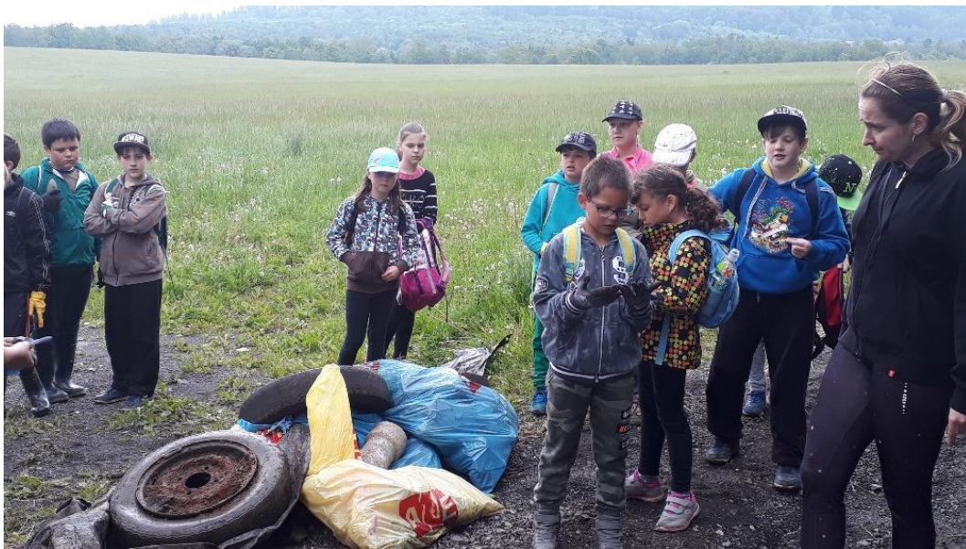
Akce „Uklidíme Česko“