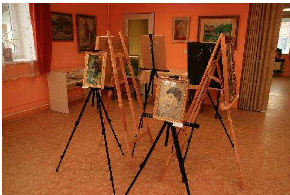
VÝSTAVA OBRAZŮ ŽENKAVSKÝCH UMĚLCŮ