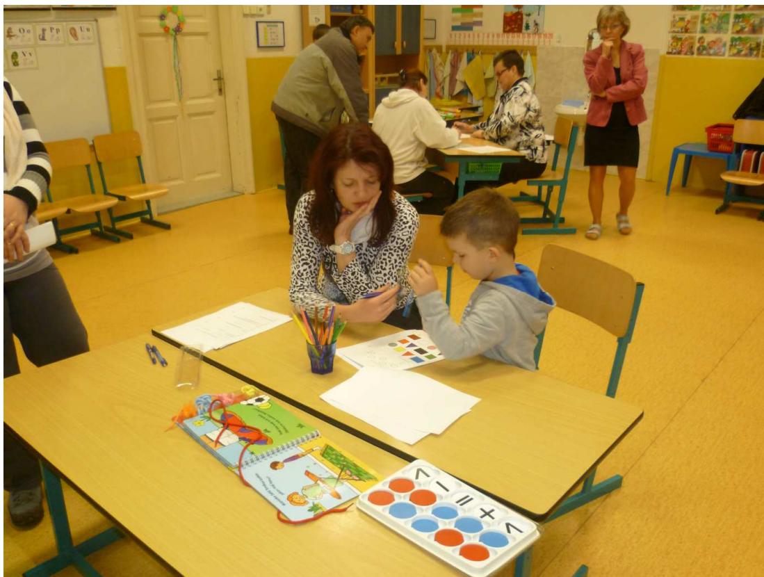
ZÁPIS DO 1.TŘÍDY