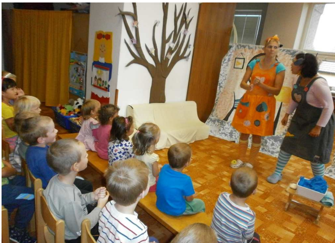
DIVADLO V MŠ