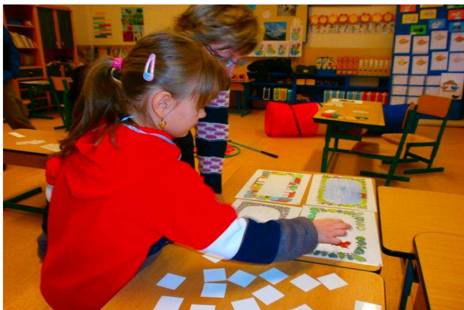
Zápis do 1.třídy

Koncem března nás ještě čeká Den otevřených dveří a velikonoční jarmark (27.3. od 15,00 hod.) Prázdniny s keramikou (28.3 .v 14,00 hod.). Všechny akce budou plakátovány a na všechny tyto akce vás srdečně zveme.