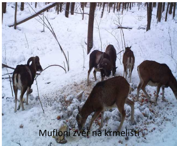
Mufloňi zvěř na krmelišti

MS má v současné době 23 členů. Hlavní orgánem sdružení je výbor,