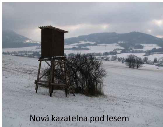
Nová kazatelna pod lesem

Myslivecké sdružení (dále jen MS) Ženklava vykonává svou mysliveckou činnost v honitbě Honebního společenstva Ženklava (dále HS). Výměra honitby dosahuje cca 1300 ha.. Zahrnuje lesní a zemědělskou půdu v katastru naší obce a částečně zasahuje do katastrů Štramberku, Rybí a Životic.