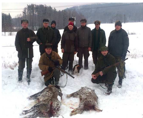
Lednová lovecká akce na Peklech mj. v min. roce bylo v naší honitbě uloveno 18 ks divočáků

s okolními honitbami podáváme spárkaté zvěři léčivé přípravky s antiparazitárním účinkem (v naší honitbě se to týká hlavně srnčí zvěře) pro léčbu a prevenci proti jejím případným nepříjemným nemocem. Jednou ročně probíhá v naší honitbě sčítání zvěře, na základě kterého je pak zvěř plánována a lovena.